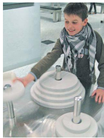
Zerrbilder entstehen im Wellenspiegel oder beim Blick auf drehende Objekte.

Zum Beispiel für die Anaglyphen: Dazu werden Fotos gleichzeitig aus zwei leicht unterschiedlichen Winkeln aufgenommen, die aus ausschließlicher in der Grundfarbe Rot, das andere in Grün.